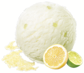
LEMON & LIME