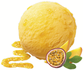
PASSION FRUIT & MANGO