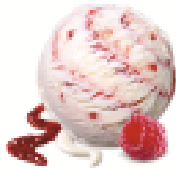
PANNA COTTA RASPBERRY